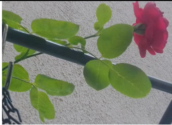
ROSE IS A ROSE IS A ROSE

Jemand wird nicht besser, aber anders und älter, so etwas ist immer ein Vergnügen.